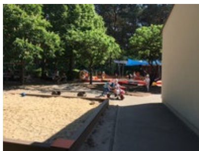
Bild vom Spielplatz