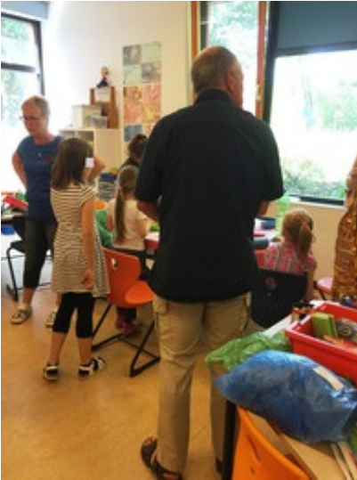
Auch der Hort wurde besucht

8. MAI 2018 - CHAOS IM KINDERFÖRDERGESETZ BLEIBT