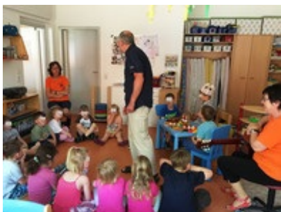
Geburtstagsfeier in der großen Gruppe

Dabei wurden auch die bestehenden Probleme angesprochen. Sie waren in der großen Gruppe zur Geburtstagsfeier, halfen auf dem Spielplatz und bei der Mittagsversorgung der Kleinsten und besuchten auch den Hort. Beide werden nach der Sommerpause, gemeinsam mit der Bundestagsabgeordneten Birke Bull-Bischoff, eine weitere Kita-Schicht einlegen und zusätzlich die Schule besuchen.