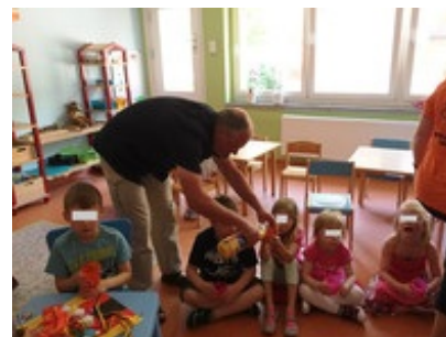
Kleine Erfrischung bei der Hitze