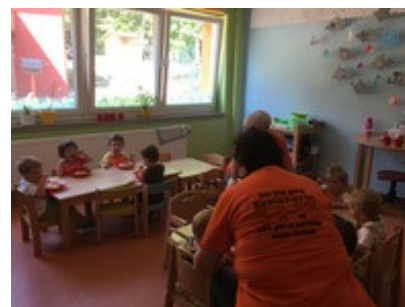
Mittagsessen der Kleinsten